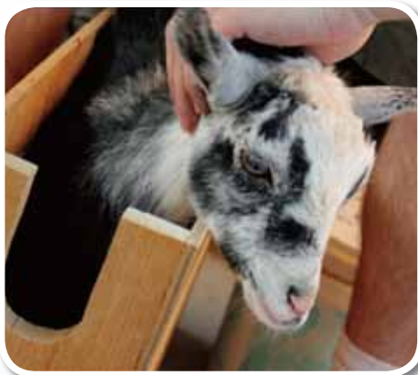
圖五、將仔羊頭頂先剃毛後，置於去角保定箱中。