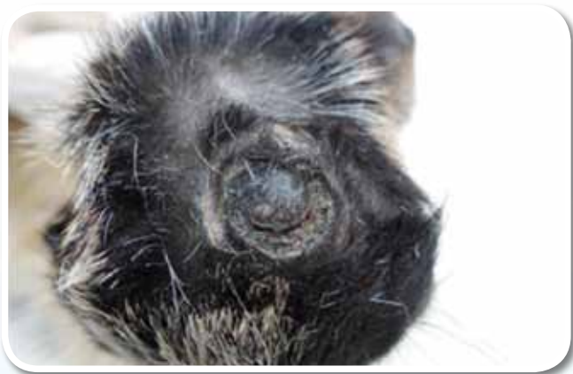
圖一、小羊去角後傷口感染。

本文所描述初生仔羊之去角本就是飼養羊隻場內例行之工作，羊隻飼養者在小羊出生後，於若干時日予以進行去角動作，去角方法多已的選擇則本就無多大可描述或討論之必要性，直到107年時候，中部某肉羊場送來年齡介於一至二月齡、曾有類似破傷風之神經症狀但已死亡之仔羊3頭，其神經症狀包括四肢僵直、食慾廢絕、下顎關節緊閉等。3頭仔羊經解剖檢查，發現頭部均有燒烙去角後之皮膚傷害病灶(圖一)，其中有2頭仔羊更傷及角附近之皮下組織(圖二)以及腦實質組織。傷口微生物好氧培養結果可見金黃色葡萄球菌特有之完全及不完全溶血圈，以及細小之完全溶血、疑似化膿隱密桿菌( Arcanobacterium pyogenes )菌落(圖三)。在之後的幾次協助中華民國養羊協會於各羊場的現場羊隻疾病防治訪視輔導過程中，也屢屢看到羊場因為燒烙去角不當，造成小羊疑似神經症狀或併發其他消化道或呼吸道疾病，甚至死亡的情形，因此寫此文章，提醒現場人員在燒烙去角時應特別注意相關觀念，才不會造成羊隻的損傷。