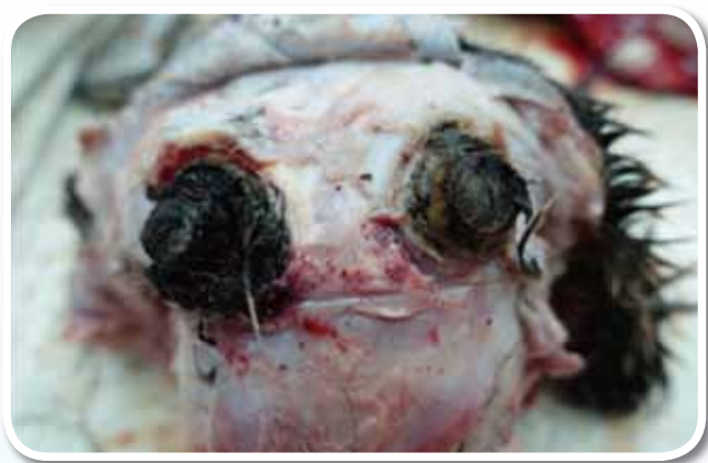
圖二、角附近皮下組織急性感染。