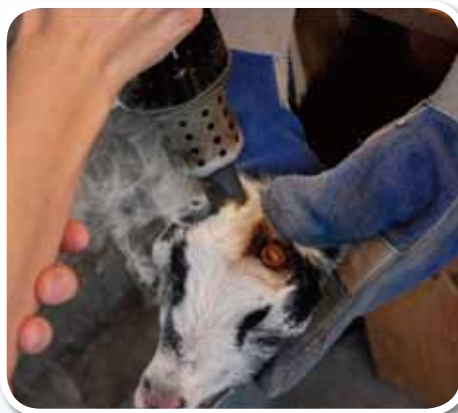
圖六、將去角烙鐵置於角芽上開始去角，順時針旋轉方式向下稍加施壓。